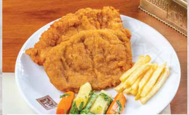
فراخ بانينة . 300.00 (served with French fries and steamed vegetables) (تقدم مع البطاطس المحمرة والخضار المسلوق)