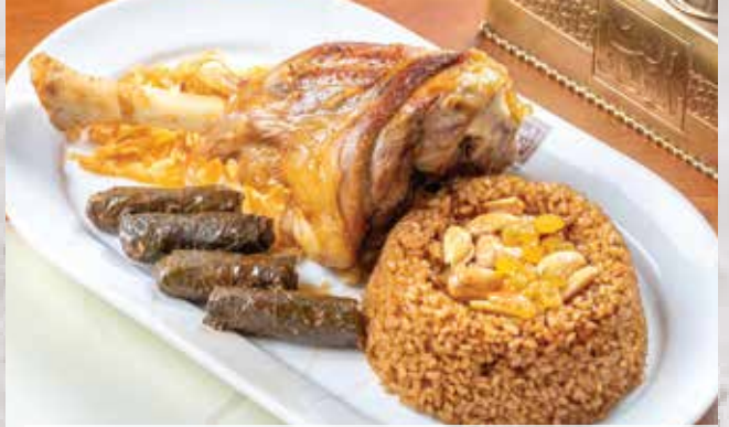
موزة مشوية / محمرة (ضانى) . 590.00 (with Khalta Rice) (مع أرز خلطة)