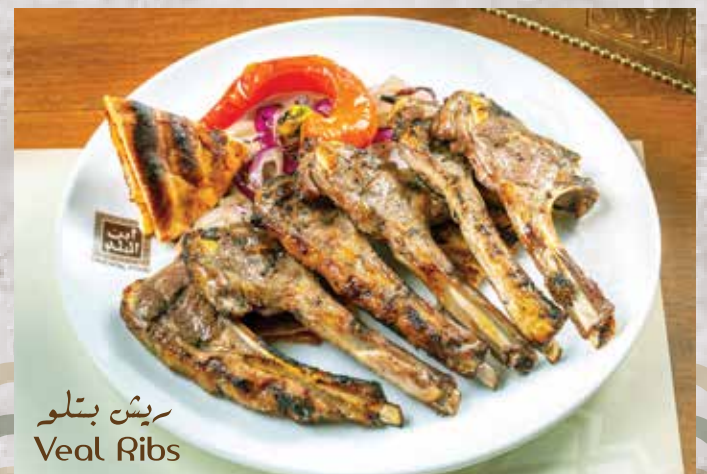
ريش بتلو Veal Ribs