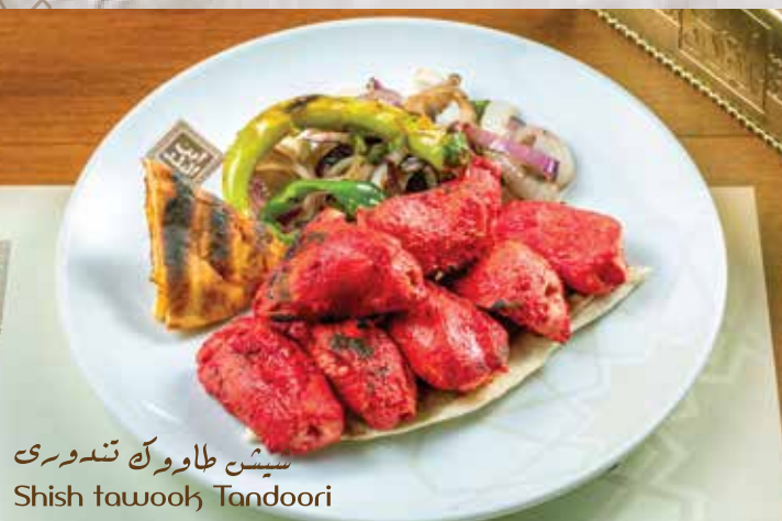
شيش طاووك تندورى Shish tawook Tandoori