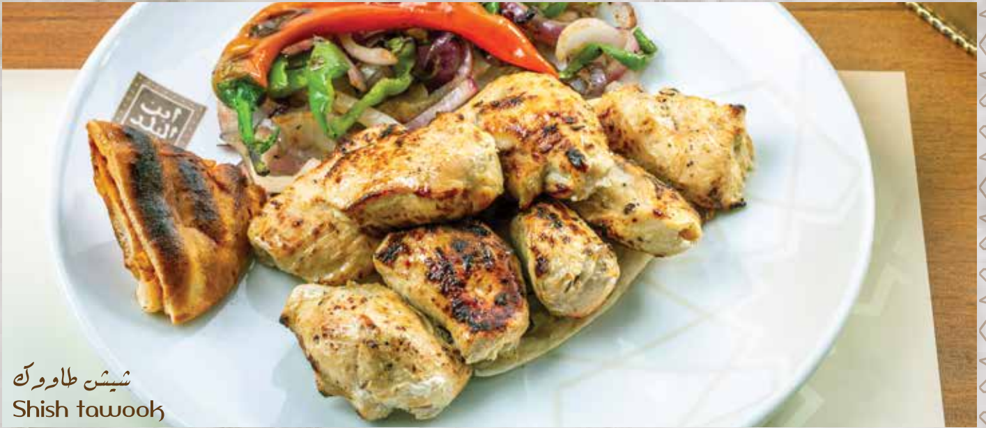
شيش طاووك Shish tawook