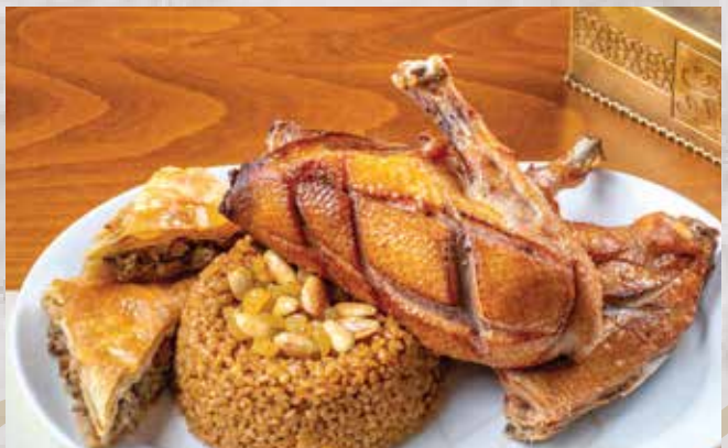
طبق بط محمر . 420.00 (half roasted duck in oven with mixture rice & rokak slices) (نصف بطه محمر بالفرن مع الأرز بالخلطة ورقاق بادي باللحمة)