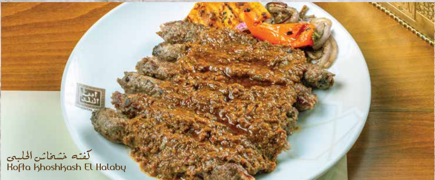
كفته خشخاش الحلبى Kofta khoshkash El Halaby