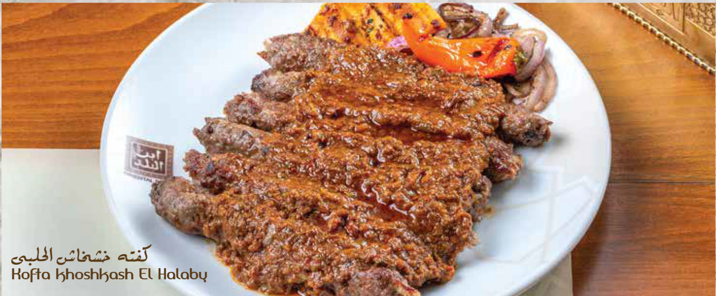
كفتة خشخاش الحلبي Kofta khoshkash El Halaby