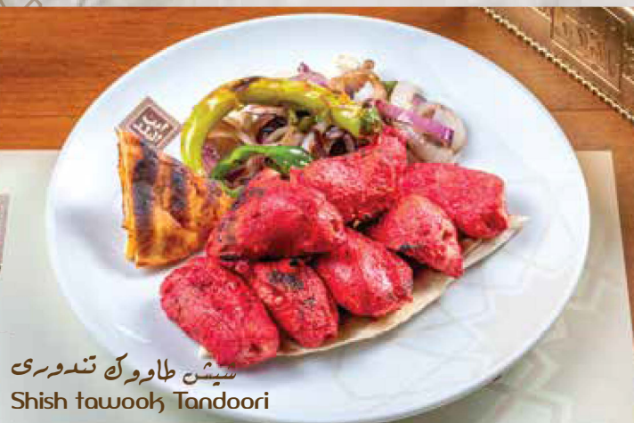
شيش طاووك تندوري Shish tawook Tandoori