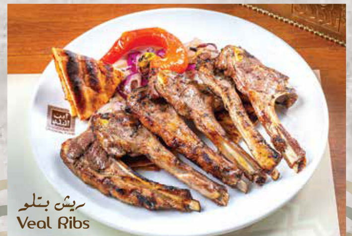
ريش بتلو Veal Ribs