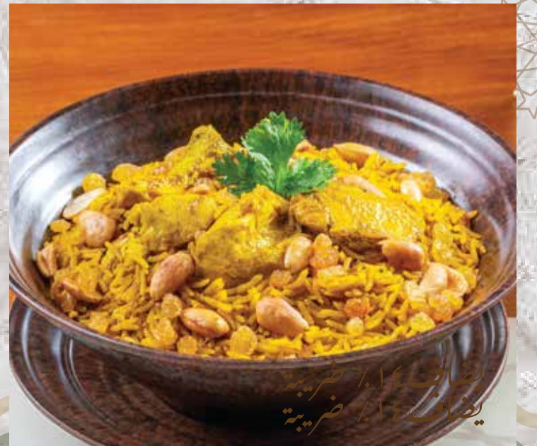
Chicken Kabsah. 306.00 كبسة فراخ (basmati rice with chicken and kabsah spices) (أرز بسمتي مع بهارات الكبسة ومكعبات الدجاج)