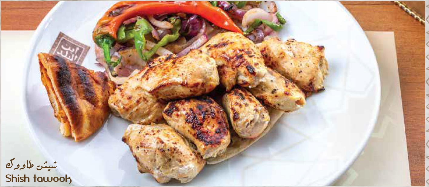
شيش طاووك Shish tawook