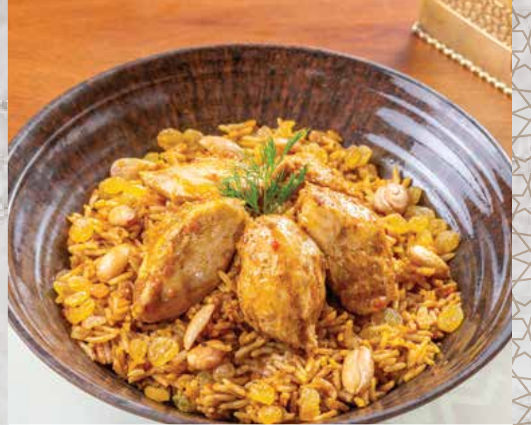
Chicken Biryani. 306.00 بريناني بالفراخ (basmati rice with chicken breast and biryani sauce) (أرز بسمتي مع صدور الدجاج المتبك وصلصة البريناني)