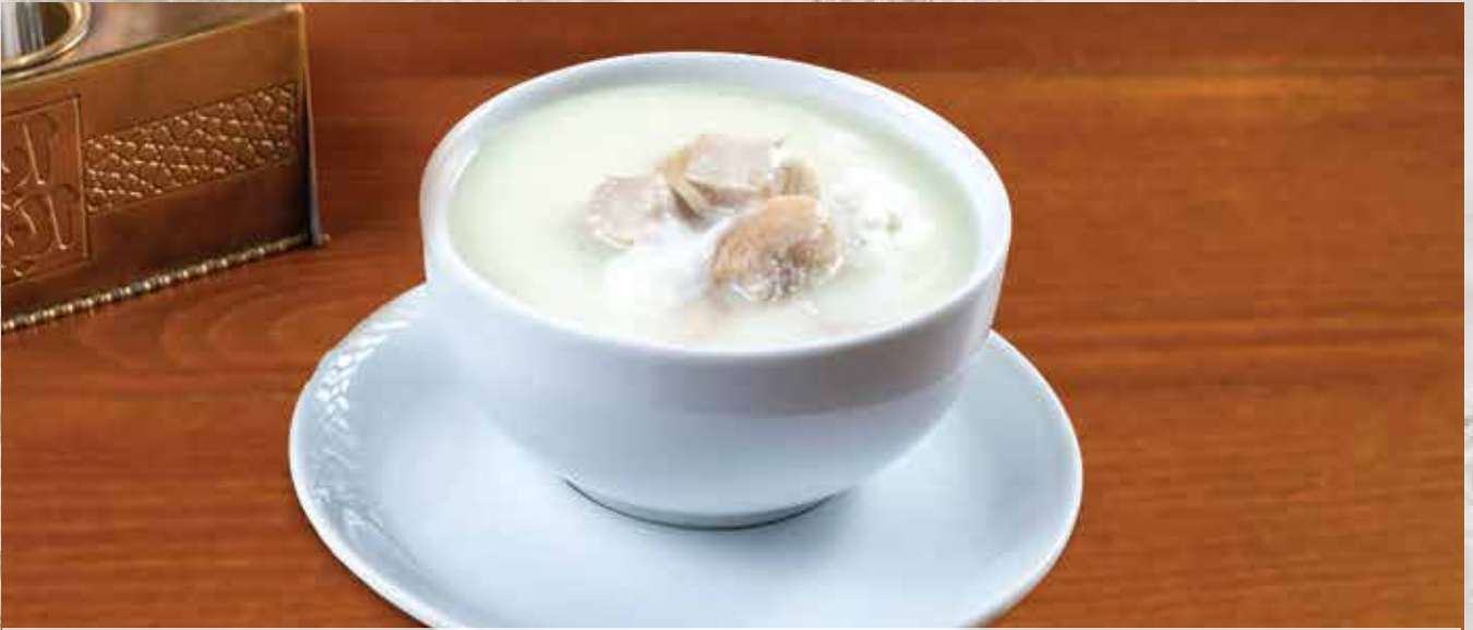
Creme De Volaille Soup