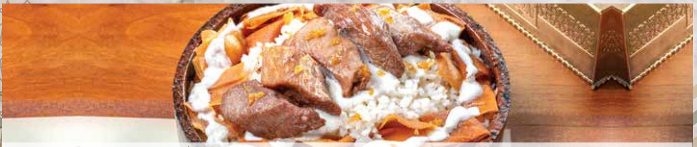
Fattah Ebn El Balad. (with toast , yogurt and veal pieces)