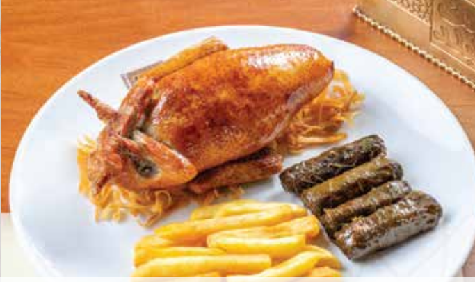
ممام محشى (ارز / فريكة) 214.00 (pigeon with ferrek, French fries and vermicelli) (ساج مع خبطة الفريك البلدى مع البطاطس المحمرة)