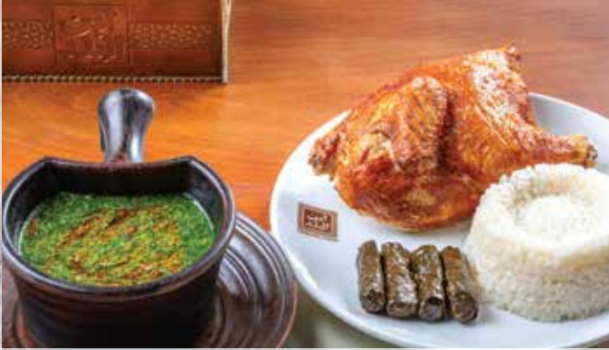
ملوخية بالفراخ 281.00 (half roasted chicken in butter with mallow and white rice) (نصف فرخة بالزبد مع ملوخية ابن البلد وأرز أبيض)