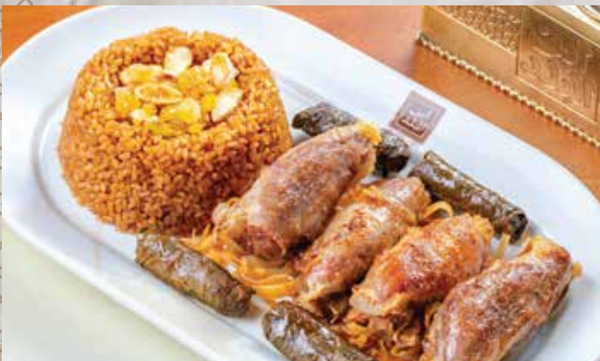
موزة مشوية / محمرة (بتلو) 587.00 (with mixture rice) (مع أرز خلطة)