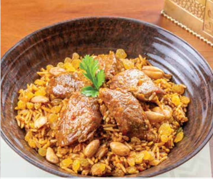
Beef Biryani. 403.00 بريناني باللحم (basmati rice with meat and biryani sauce) (أرز بسمتي مع مكعبات اللحم وصلصة البريناني)